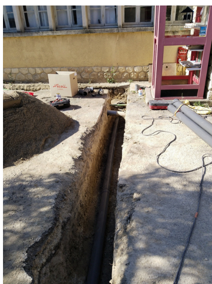
Eau et assainissement

Par ailleurs, certains travaux de canalisation des eaux pluviales ont été réalisés suite à la violence des orages