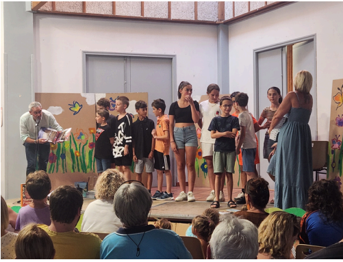
Traditionnelle remise des calculatrices et d'un ouvrage aux élèves de CM2

Le conseil municipal des enfants a été studieux avec le nettoyage du village le 26 avril puis avec leur très beau spectacle où près de 300 euros ont été recueillis au profit de l'école.