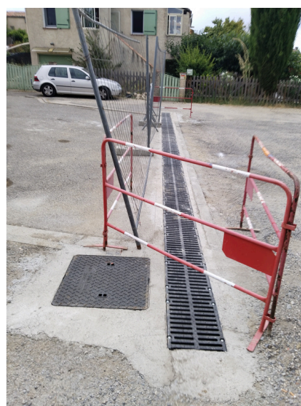
Gestion des eaux pluviales