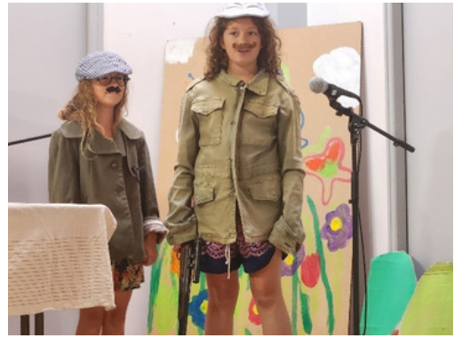
Spectacle du Conseil Municipal des Enfants